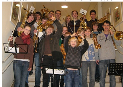
Das JBO nach seinem Auftritt in der Helfensteinklinik

Mit Weihnachtsliedern auf jedem Stockwerk bereitete das JBO den Patienten der Helfensteinklinik am 16.12. eine Freude.